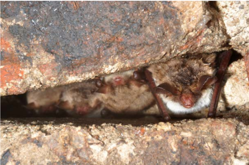
Fot. 8. Nocek Bechsteina w towarzystwie nocków Natterera w Bastionie Król. Photo 8. Bechstein's bat and a group of Natterer's bats in Bastion Król.