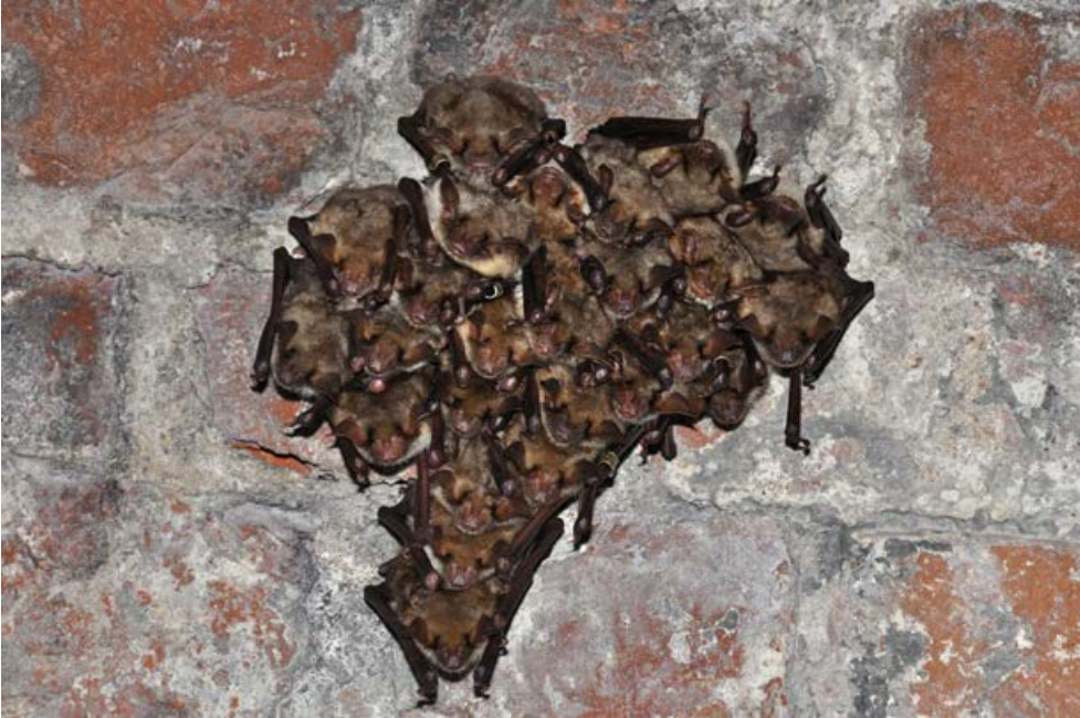
Fot. 7. Grupa nocków dużych zimujących w Bastionie Król. Photo 7. Group of greater mouse-eared bats wintering in Bastion Król.