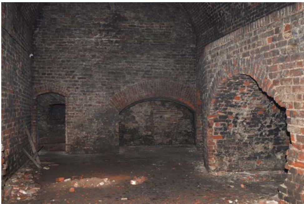
Fot. 6. Wnętrze Bastionu Król. Photo 6. Interior of Bastion Król.