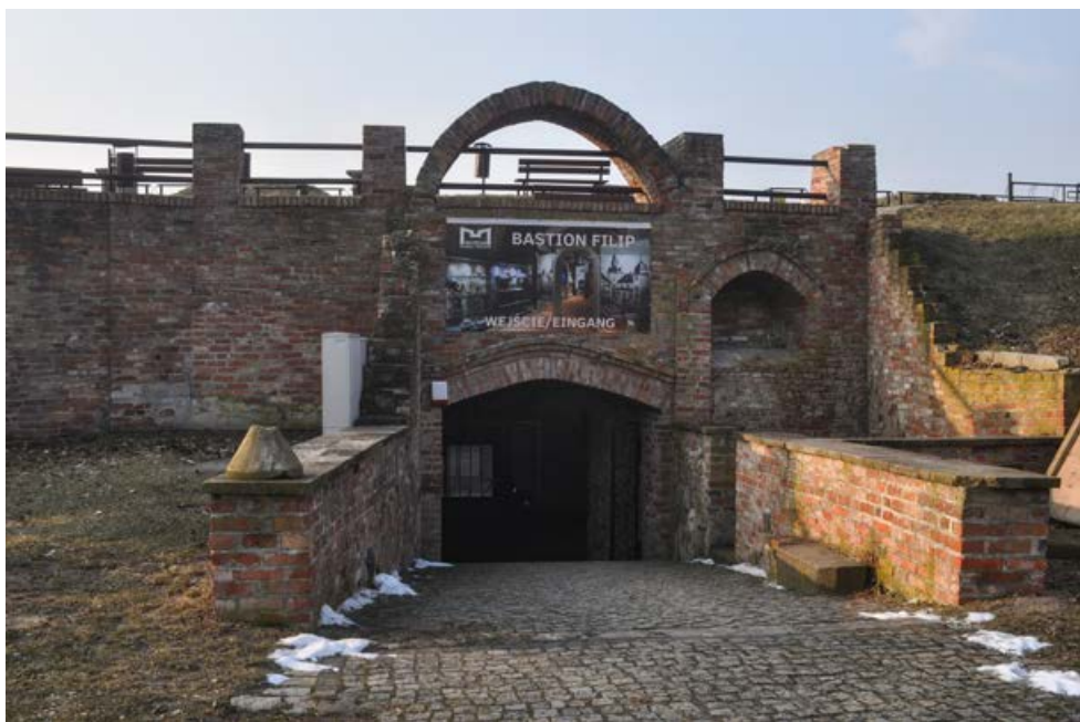
Fot. 4. Wejście do Bastionu Filip. Photo 4. Entrance to Bastion Filip.