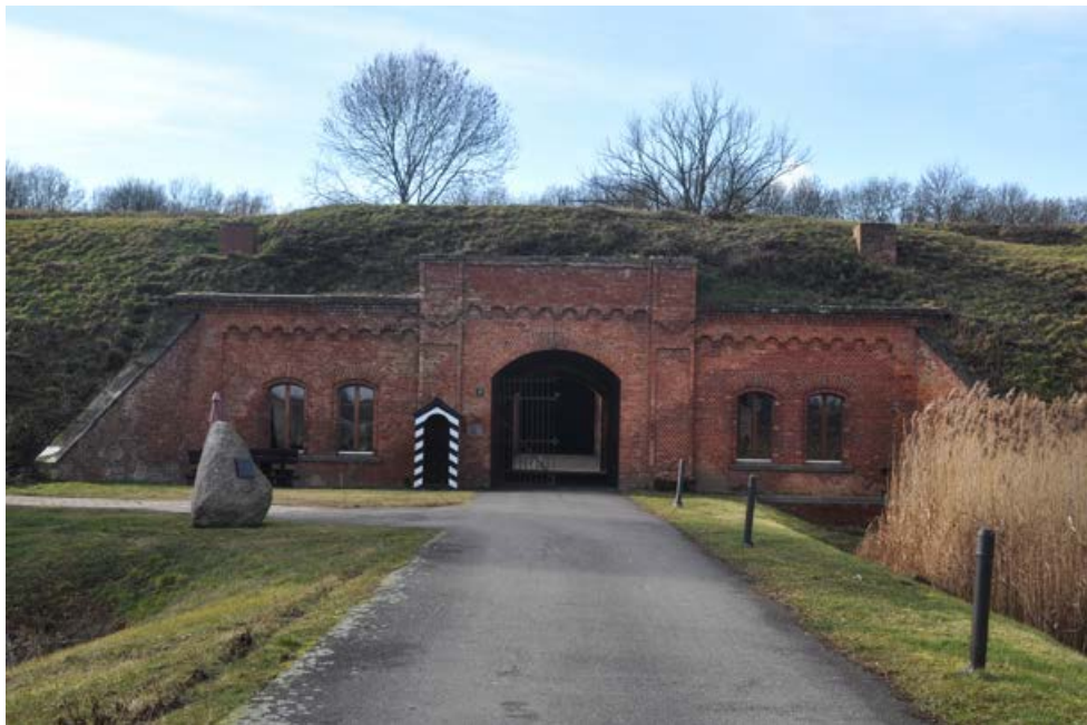
Fot. 3. Brama wjazdowa do Fortu Gorgast w Niemczech. Photo 3. Entrance gate to Fort Gorgast in Germany.