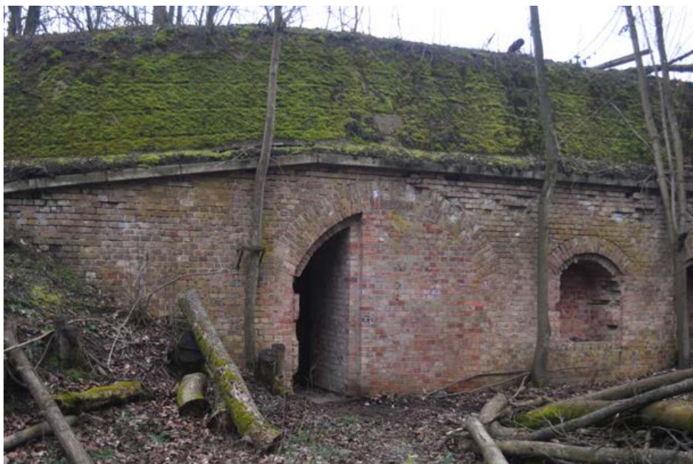
Fot. 2. Fort Żabice. Photo 2. Fort Żabice.