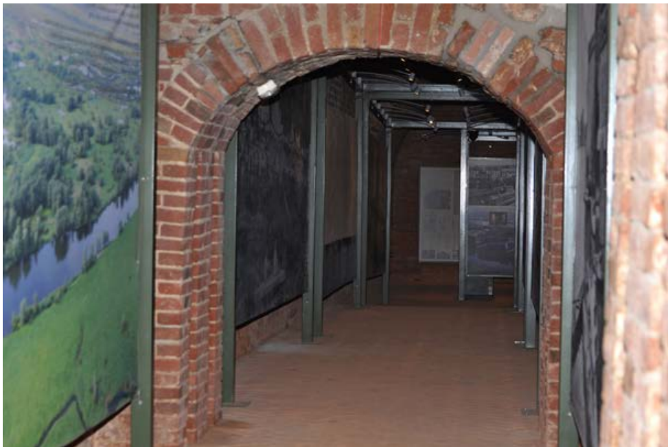
Fot. 5. Ekspozycja muzealna wewnątrz Bastionu Filip. Photo 5. Museum exhibition inside Bastion Filip.