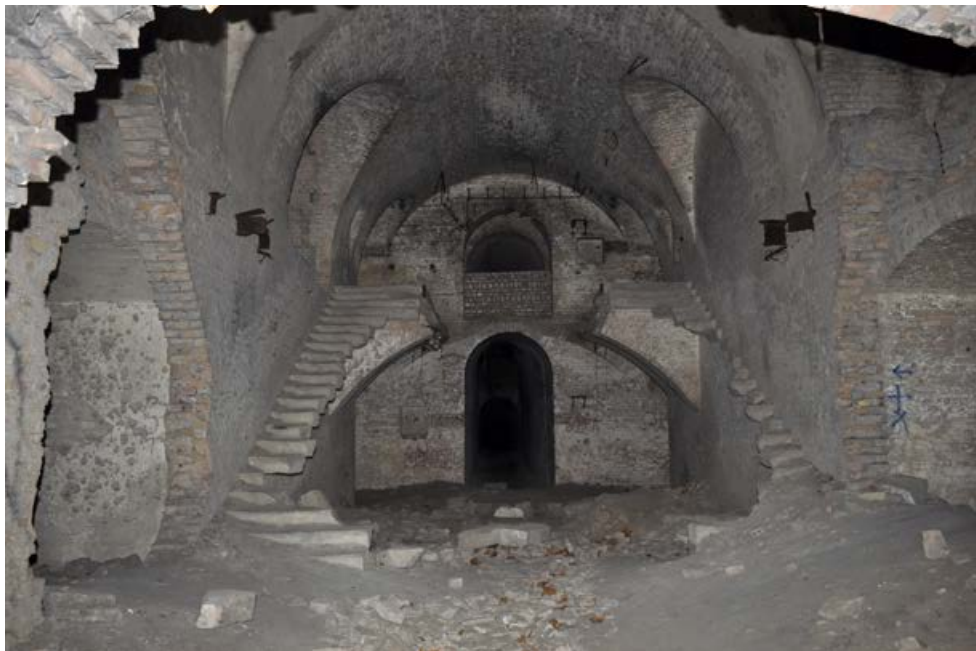
Fot. 1. Zdewastowane wnętrze Fortu Sarbinowo. Photo 1. Devastated interior of Fort Sarbinowo.